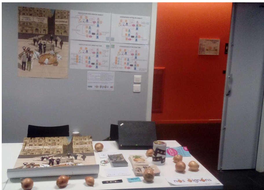
FIG. 2: Une photo du stand du Campus du livre 2019