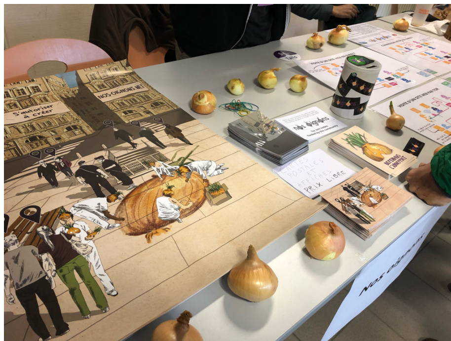
FIG. 1: Une photo du stand du Capitole du Libre 2019

Comme chaque année nous avons eu un stand. Cela a été l'occasion de tenir au courant de nos activités et de diffuser nos affiches et cartes postales. 57,13 euros de dons ont été récoltés.